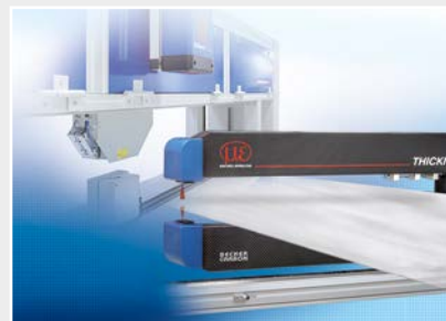
Installations de mesure et de contrôle pour l'assurance qualité