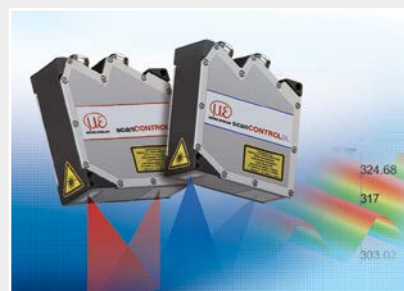
Capteurs de profil à ligne laser par triangulation 2D/3D