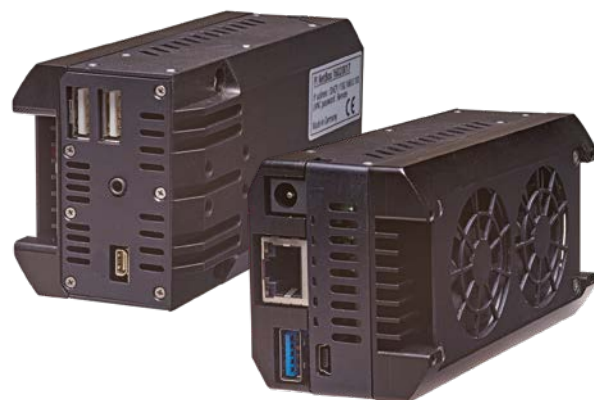
thermoIMAGER TIM NetBox