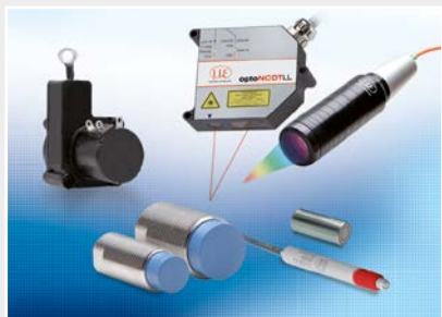
Capteurs de déplacement, de distance, de longueur et de position