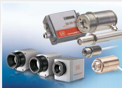
Capteurs et systèmes de mesure de température sans contact (pyromètres)