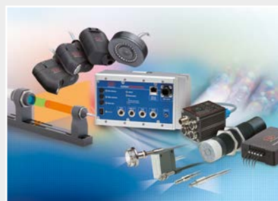
Capteurs de couleurs pour DEL et surfaces