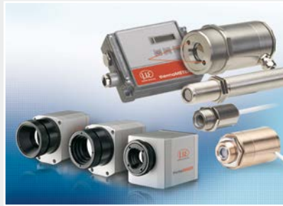
Sensoren und Messgeräte für berührungslose Temperaturmessung