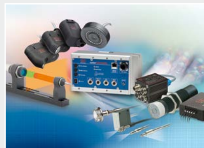
Sensoren zur Farberkennung, LED Analyser und Online-Farbspektrometer