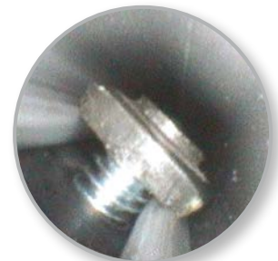
Sitz einer Schraube