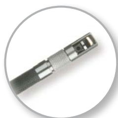
90° Prismenkopf (optional)